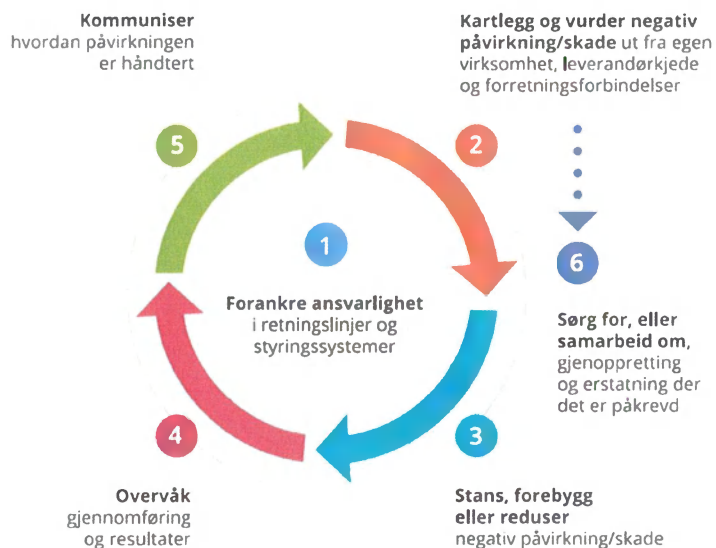
Figur: OECDs kontaktpunkt

Aktsomhetsvurderinger utføres i tråd med OECDs retningslinjer for flernasjonale selskaper, som innebærer en 6-stepsprosess.