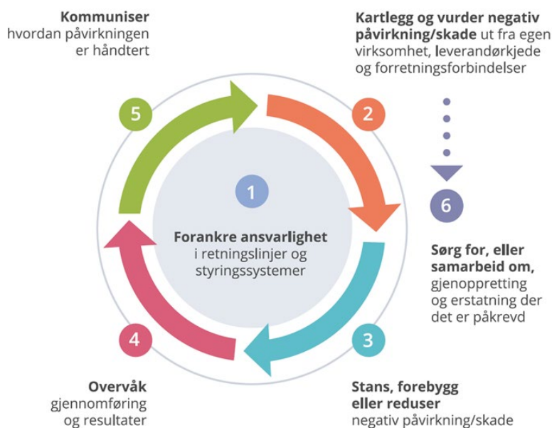
Figur: OECDs kontaktpunkt

Aktsomhetsvurderinger utføres i tråd med OECDs retningslinjer for flernasjonale selskaper, som innebærer en 6-stepsprosess.